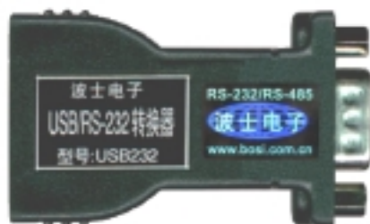
图 1 波仕电子的型号为 USB232 的 USB/RS-232 转换器

Visual BASIC 和 Visual C++语言的 Mscomm.ocx 通信控件编程后进行通信检测，波仕的 USB232 可以在各种版本的 Windows 下很流畅地正确通信并且对 RTS/CTS、DTR/DSR 握手信号的控制与监测也很正确，而有些市售的 USB/串口转换器却不能够通过这样的检测。