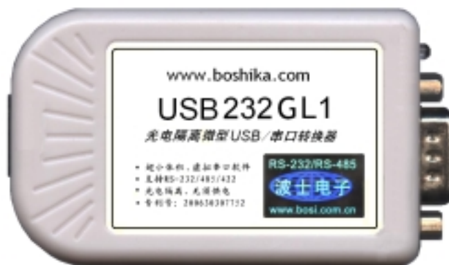
图 3 波仕电子的型号为 USB232GL1 的光电隔离 USB/RS-232/485/422 转换器

第三代 USB 串口通信产品不仅可以从 USB 口直接扩展出 RS-232、RS-485、RS-422 口，而且实现了光电隔离又无须供电。波仕 USB232GL1 光电隔离微型 USB/串口转换器（如图 3）秉承波仕转换器的一贯特色，具有超小型的外形（80*23*47mm）、RS-232、RS-485、RS-422 通用，可以虚拟成为本地 COM 串口（COM1-COM256）、无须修改已有的串口通信软件。