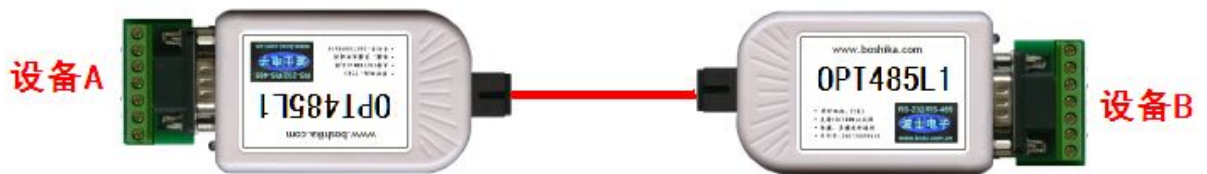
图 2 单纤双向通信

典型应用 1：在图 2 中，串口设备 A 与串口设备 B 都配有 RS-232、RS-485 或者 RS-422 接口，通过两台 OPT485L1 光纤转换器（T5R3 与 T3R5 配对）可实现设备 A 与设备 B 之间的远程光纤通信。