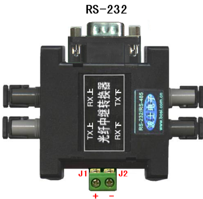
使用 DB-9 针座的 RS-232 口