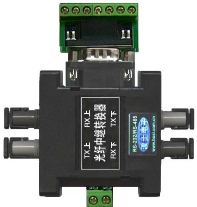
使用 RS-485/RS-422 或 RS-232 接线端子